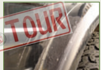
Überpinseln bald zwecklos: Rost zwischen Radlauf und Seitenteil