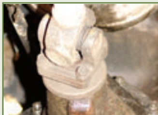
Die Kardangelenke: Arthrose ist ein Fremdwort für sie