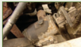
Kein Spielkind: stabiles, nachstellbares Lenkgetriebe