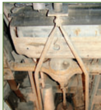
Gut geschützt: Der solide Auspuff setzt im Gelände nicht auf