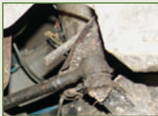
Spiel ohne Grenzen: Die Aufnahme des Lenkhebels schlägt aus