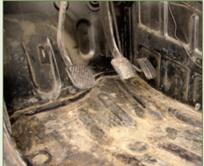
Für die Füße: Ob Bodenwannen, Mittelteil oder Spritzwand – sämtliche Bereiche der Karosserie gelten als schnell vergänglich