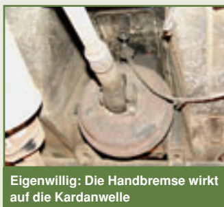
Eigenwillig: Die Handbremse wirkt auf die Kardanwelle