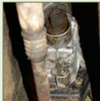
Die Dritten: Geht der dritte Gang kaum rein, droht Zahnausfall