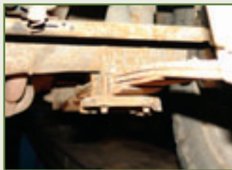
Die Müdigkeit der Jahre: ermattete vordere Blattfeder