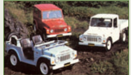
Dreigestirn: In Deutschland wurde der LJ nur in der offenen Version angeboten

Der Antrieb zeigt sich überwiegend zählig. So gelten die Achsen als nahezu unzerstörbar: „Die gibt es zuhauf, weil sie übrig bleiben, wenn der Rest des Fahrzeugs schon den Weg alles Irdischen gegangen ist“, schmunzelt der Off-Road-Profi. Einziger Schwachpunkt hier ist die Differentialsperre der Hinterachse, die als Parksperre und nicht für den Geländeeinsatz gedacht war und nur an Autos für den