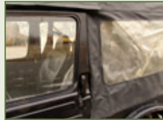
Ein Witz: Das klapprige Zelt bietet nur rudimentären Wetterschutz