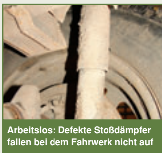
Arbeitslos: Defekte Stoßdämpfer fallen bei dem Fahrwerk nicht auf