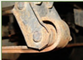
Gnadenlos hart: die originalen Gummi-Fahrwerksbuchsen