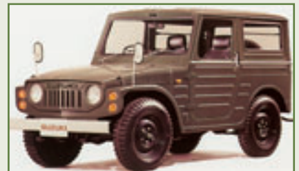
LJ 50: Der Vater des LJ 80 hatte einen durstigen Dreizylinder-Zweitaktmotor

deutschen Markt zu finden ist, weil dem TÜV die auf die Kardanwelle wirkende Handbremse nicht ausreichte. „Am besten legt man sie still, weil die Sperren dazu neigen, sich während der Fahrt selbst einzulegen, oder baut sich eine zuverlässige Betätigung.“