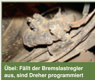
Übel: Fällt der Bremslastregler aus, sind Dreher programmiert