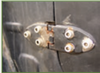
...Rosts Speiseplan wie die Seitenteile des Suzuki