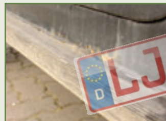
Schlimmes Innenleben: Schweller und Einstieg mit Make-up