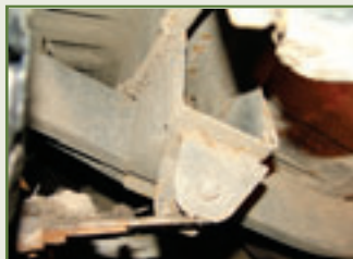
Rahmenhandlung: Abgesehen von Auslegern wie diesen...