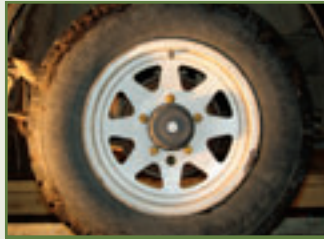
Extrabreit: 205er sind die Grenze des Erträglichen für das Fahrwerk