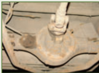
Ewig ausgleichend: Differenziale und Achsen sind fast unzerstörbar