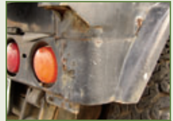
Dickes Ende: Heckschürze und Radläufe leiden unter Lochfraß