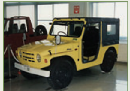
LJ 10: Den 1970 vorgestellten Urahn aller LJ schob ein 360-Kubik-Zweitakter sanft voran