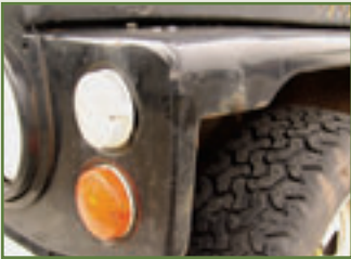
Maske des Grauens: Front und Kotflügel stehen ebenso auf...