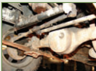
Überfordert: Mit Breitreifen schlägt das Lenkgestänge aus