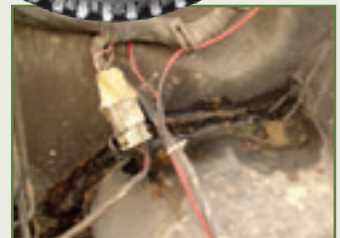
Jetzt geht's los: Schweißstöße gammeln besonders zügig