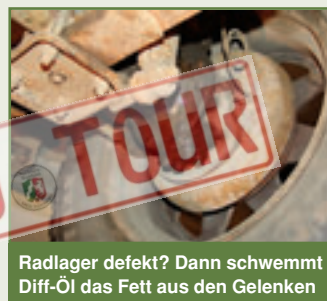
Radlager defekt? Dann schwemmt Diff-Öl das Fett aus den Gelenken