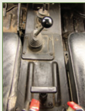
Schaltstelle: Lässt sich das Verteilergetriebe schalten?