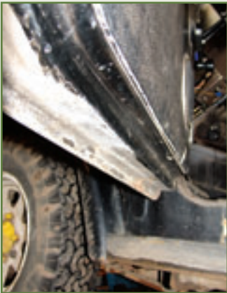
Ganz unten: Die Türen sind von den Böden abgesehen rostresistent