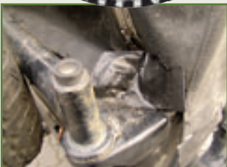
Das Klebeband verrät: Auch dieses Verdeck hat's hinter sich