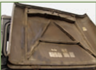
Zu Recht eine große Klappe: Die Haube widersteht dem Gilb