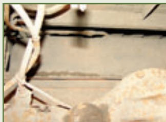
Nicht ganz dicht: Der Tank ist dünnhäutig und rostanfällig