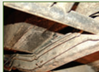
...gilt wenigstens der stabile Leiterraum als rostresistent